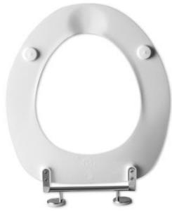
2 Sitzpuffer SP42