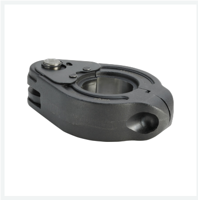
Pressring für Megapress Modell 4296.1