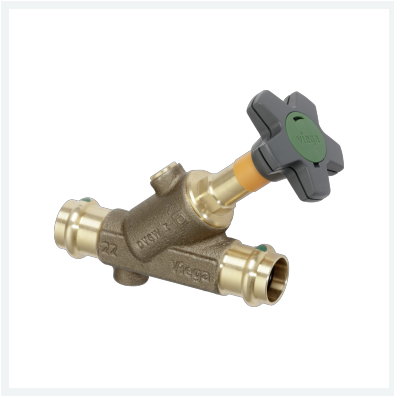
Easytop-Schrägsitzventil (Freistromventil) mit SC-Contur Modell 2237.5 Artikel 756 918