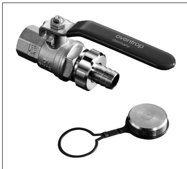
Kugelhahn mit Schlauchverschraubung