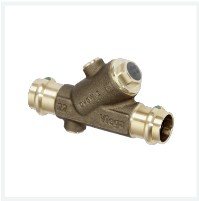
Easytop-Rückflussverhinderer mit SC-Contur Modell 2239.4 Artikel 757 526