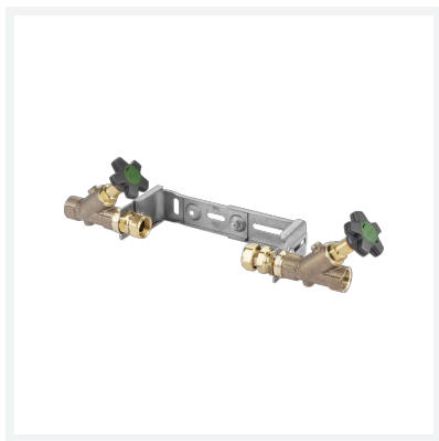
Easytop-Montageeinheit Modell 2230.11 Artikel 717 902