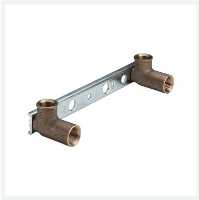
Gemini-Montageeinheit Modell 94478 Artikel 124 892