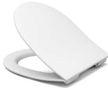
Öffnungswinkel max. 110°