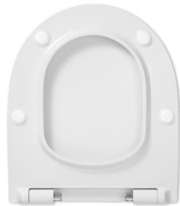
2 Deckelpuffer DPV5 4 Sitzpuffer SPV8