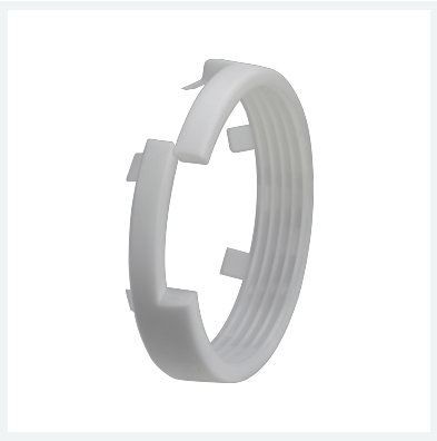
Geopress-Klemmring Modell 9615.8