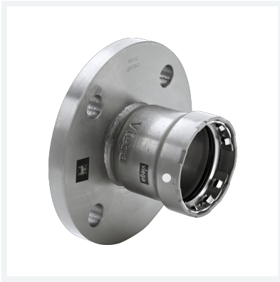
Megapress S-Flanschübergang mit SC-Contur Modell 4359.1 Artikel 770 822