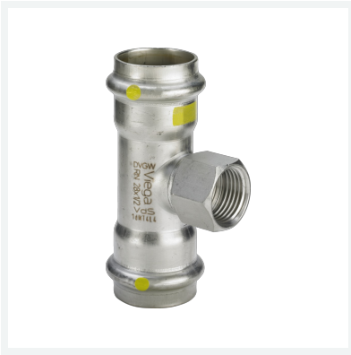
Sanpress Inox G-T-Stück mit SC-Contur Modell 0217.2 Artikel 486 709