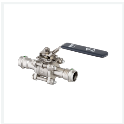
Easytop-Kugelhahn Sanpress Inox-Pressanschlüsse 3-teilig mit SC-Contur Modell 2375.8 Artikel 766 771