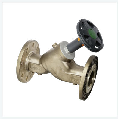
Easytop XL-KRV-Schrägsitzventil (Kombiniertes Freistromventil mit Rückflussverhinderer) Modell 2238.5XL Artikel 757 397