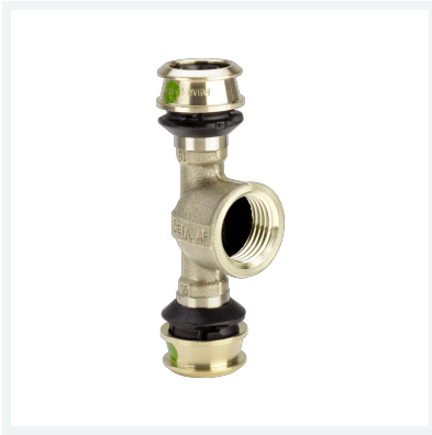
Raxofix-T-Stück mit SC-Contur Modell 5317 Artikel 647 193