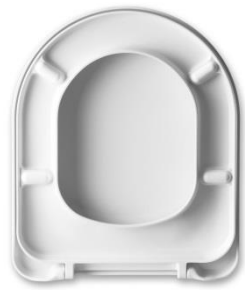
2 Deckelpuffer DP97 4 Sitzpuffer SP97