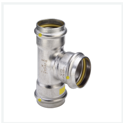
Sanpress Inox G-T-Stück mit SC-Contur Modell 0218 Artikel 486 594