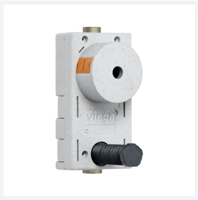
Easytop-UP-Wohnungswasserzählereinheit Modell 2231.13 Artikel 758 325