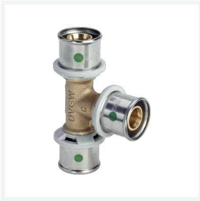
Sanfix P-T-Stück mit SC-Contour - Pressanschlüsse Modell 2118