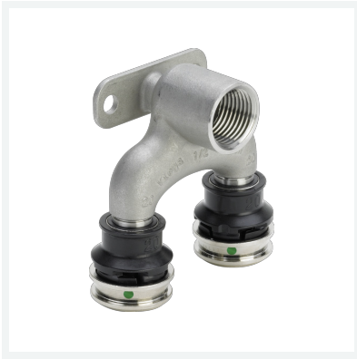
Raxinox-Doppelwandscheibe mit SC-Contur Modell 4425.7 Artikel 723 279