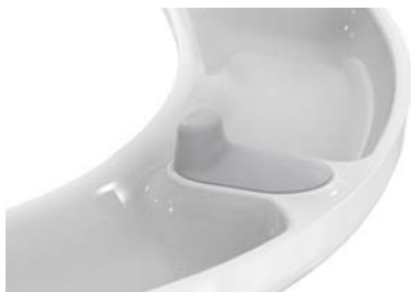
„Puffer m. Verdrehenschutz“