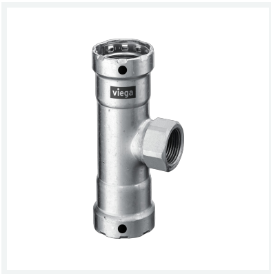
Megapress-T-Stück mit SC-Contur Modell 4217.2 Artikel 695 194