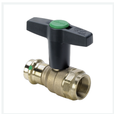
Easytop-Kugelhahn mit SC-Contur Modell 2275.4 Artikel 746 780