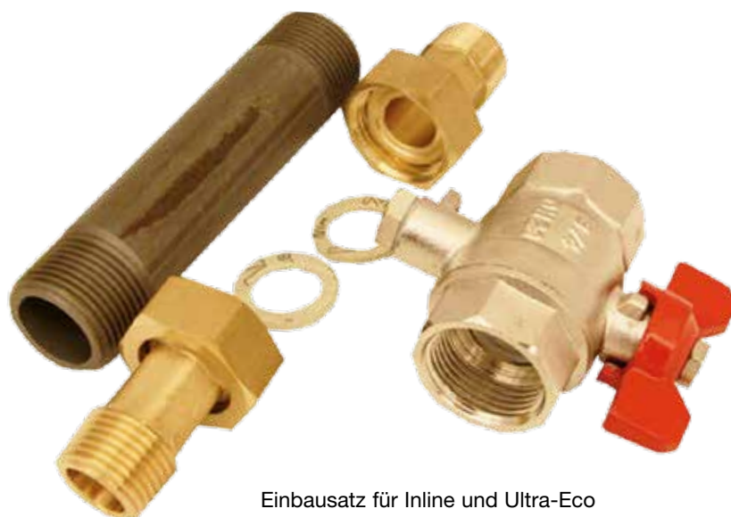
Einbausatz für Inline und Ultra-Eco

Der Einbausatz besteht aus einem Rohrnippel, einem Vorlaufkugelhahn sowie den passenden Anschlussverschraubungen.