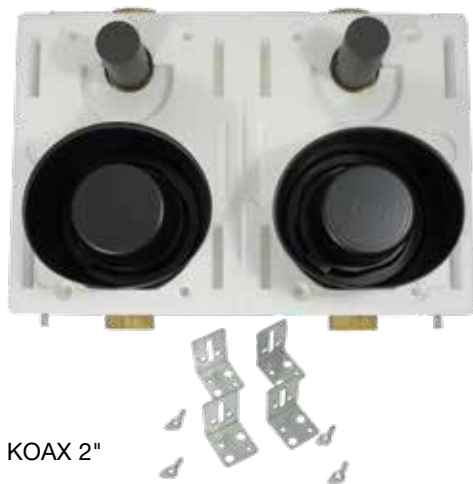
MB DUO KOAX 2"

Mediumtemperatur Kaltwasser als auch für Warmwasser funktionsbereit und hält einen Druck von 10 bar aus. Die Messkapseln KOAX 2" bieten die Möglichkeit, Module zur Fernablesung nachzurüsten.