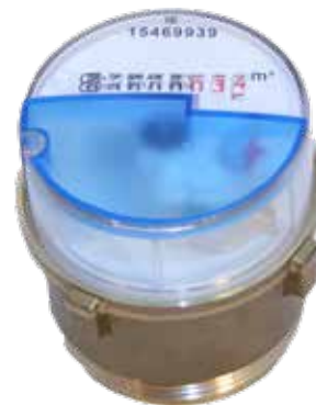
Messkapsel KOAX 2"