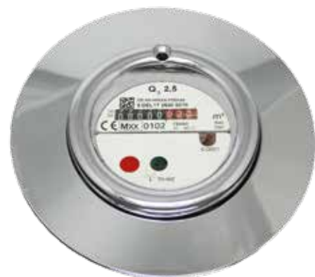
Trockenkapsel mit Chromgarnitur