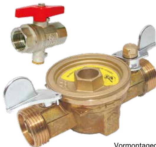
Vormontagegehäuse für TKS-WM

Das Vormontagegehäuse hat zwei integrierte Kugelhahnabsperrungen und einen zusätzlichen Vorlauf-Kugelhahn mit einem 3/4" IG.