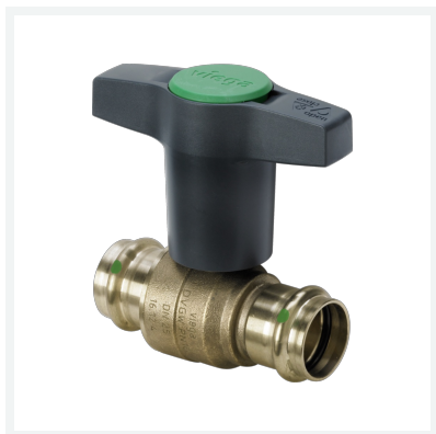
Easytop-Kugelhahn mit SC-Contur Modell 2275 Artikel 746 377