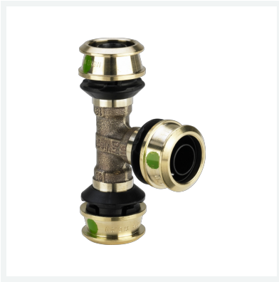
Raxofix-T-Stück mit SC-Contur - Pressanschlüsse Modell 5318