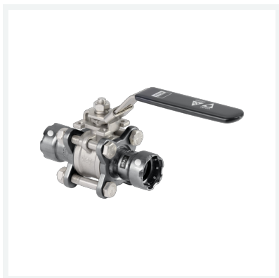
Easytop-Kugelhahn Megapress S-Pressanschlüsse 3-teilig mit SC-Contur Modell 4375.8 Artikel 787 233