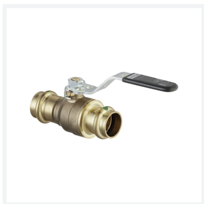
Easytop-Kugelhahn mit SC-Contur Modell 2275.10 Artikel 774 899