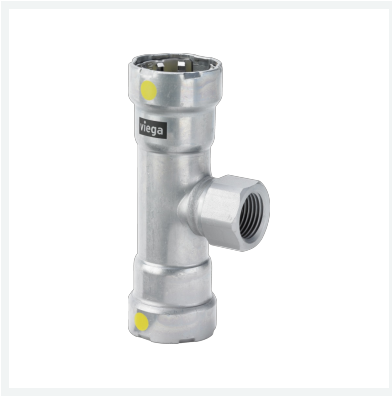
Megapress G-T-Stück mit SC-Contur Modell 4617.2 Artikel 762 896