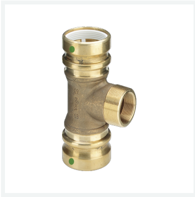
Geopress-T-Stück mit SC-Contur Modell 9617.1TW Artikel 767 235