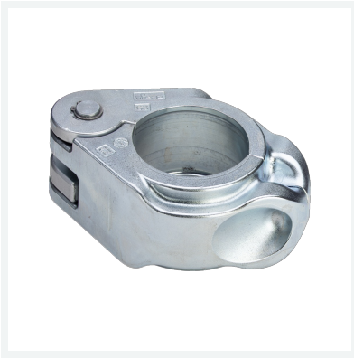
Pressring für Geopress Modell 9696.1