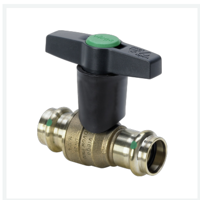
Easytop-Kugelhahn mit SC-Contur Modell 2275CO Artikel 746 445