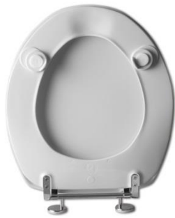
2 Deckelpuffer DP96 2 Sitzpuffer WP59