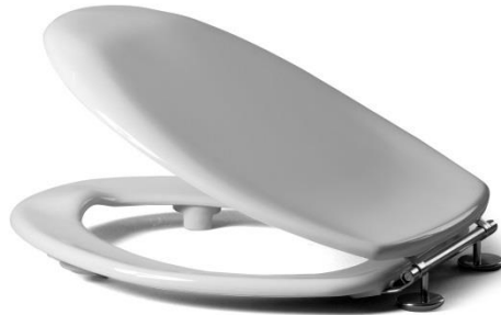
Öffnungswinkel = 180°