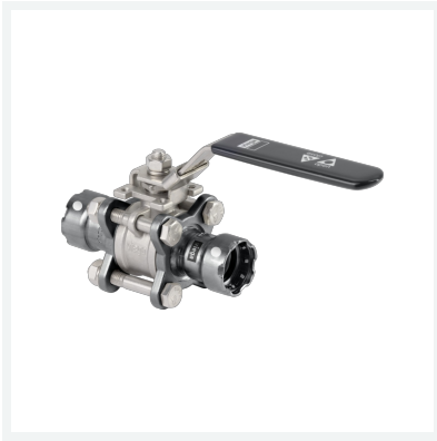
Easytop-Kugelhahn Megapress S-Pressanschlüsse 3-teilig mit SC-Contur Modell 4375.8 Artikel 787 677