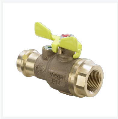
Profipress G-Gaskugelhahn mit SC-Contur Modell 2671.3 Artikel 659 318