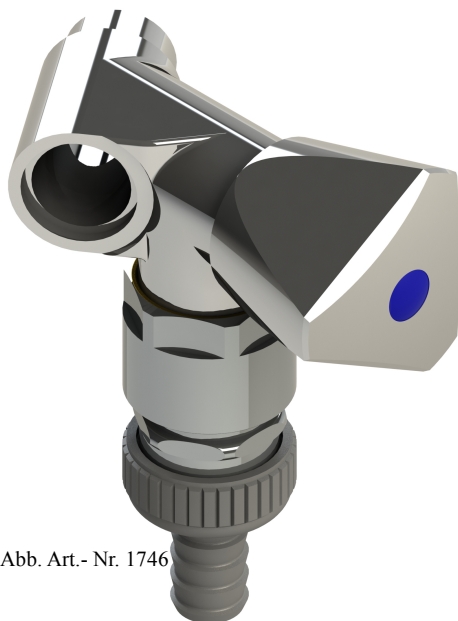
Abb. Art.- Nr. 1746

Artikelnummer: 00 1746 1550 001 mit Standardgriff 00 7146 1550 001 mit Designgriff