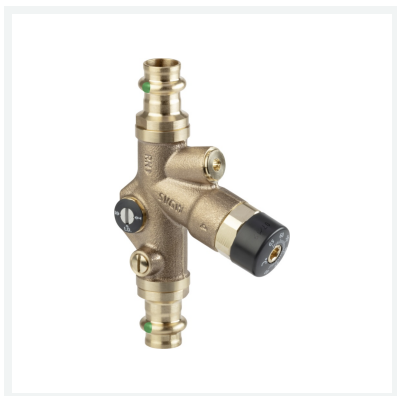
Easytop-Zirkulationsregulierventil thermostatisches Regulierventil mit SC-Contur Modell 2281.7 Artikel 778 811