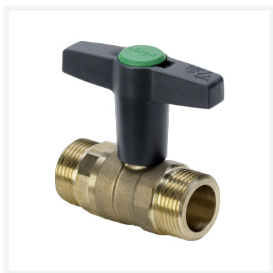
Easytop-Kugelhahn Modell 2275.1 Artikel 746 988