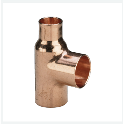
T-Stück Modell 95130 Artikel 102 890