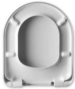
2 Deckelpuffer DP96 4 Sitzpuffer SP97