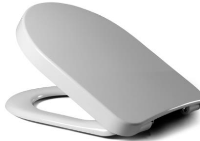
Öffnungswinkel max. 110°