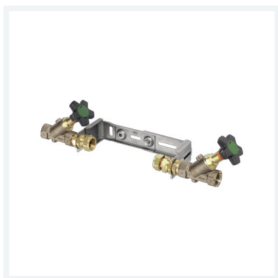
Easytop-Montageeinheit Modell 2230.10 Artikel 746 216