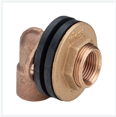
Wanddurchführung Modell 3426 Artikel 333 911