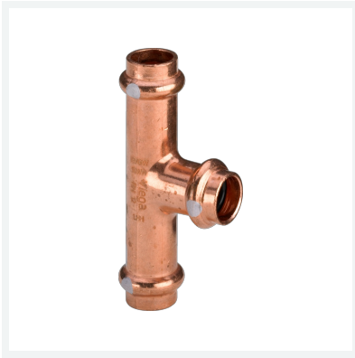
Profipress S-T-Stück mit SC-Contur Modell 4518 Artikel 628 567