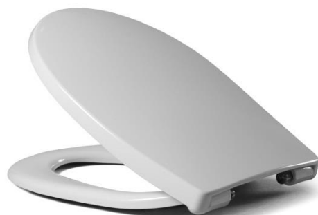
Öffnungswinkel max. 110°