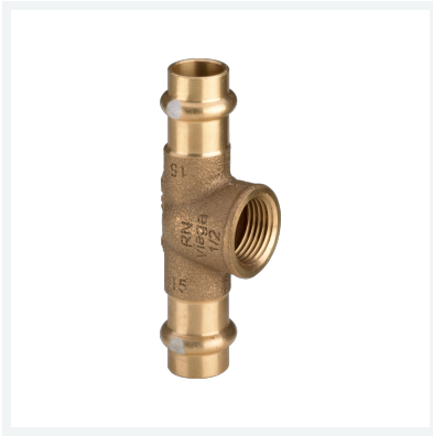
Profipress S-T-Stück mit SC-Contur Modell 4517.2 Artikel 628 642