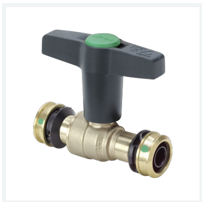
Easytop-Kugelhahn mit SC-Contur Modell 5375 Artikel 746 667