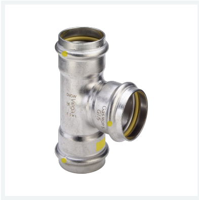
Sanpress Inox G-T-Stück mit SC-Contur Modell 0218 Artikel 486 488