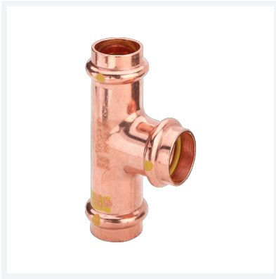
Profipress G-T-Stück mit SC-Contur Modell 2618 Artikel 346 119