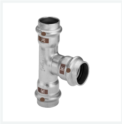
Temponox-T-Stück mit SC-Contur Modell 1718 Artikel 810 368