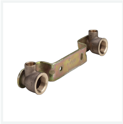
Gemini-Montageeinheit Modell 94476.0 Artikel 101 091