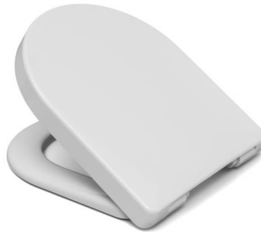
Öffnungswinkel max. 110°