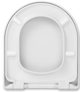
2 Deckelpuffer DP97 4 Sitzpuffer SP97